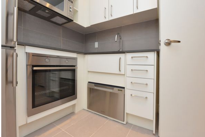
56 Maitland Street