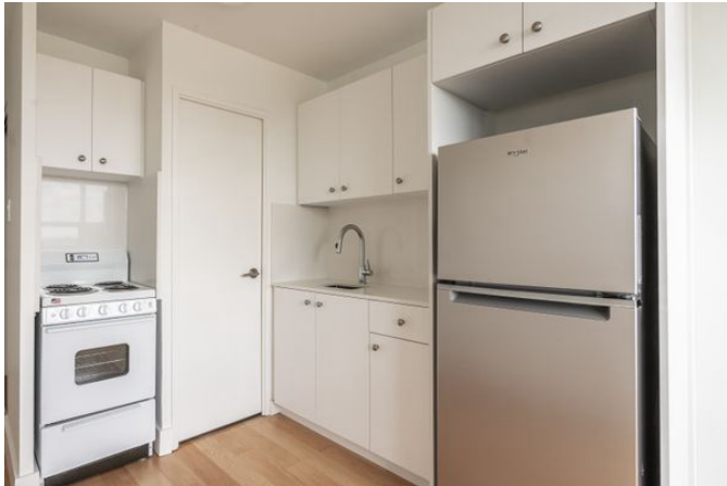
730 St Clarens Avenue