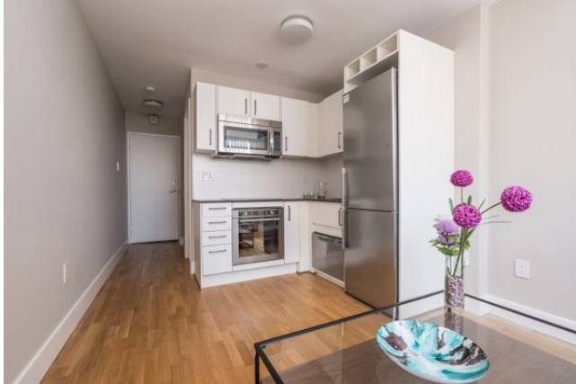
730 St Clarens Avenue